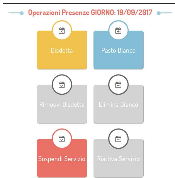
Portale Genitori 2: Menu delle operazioni possibili per il giorno di calendario selezionato