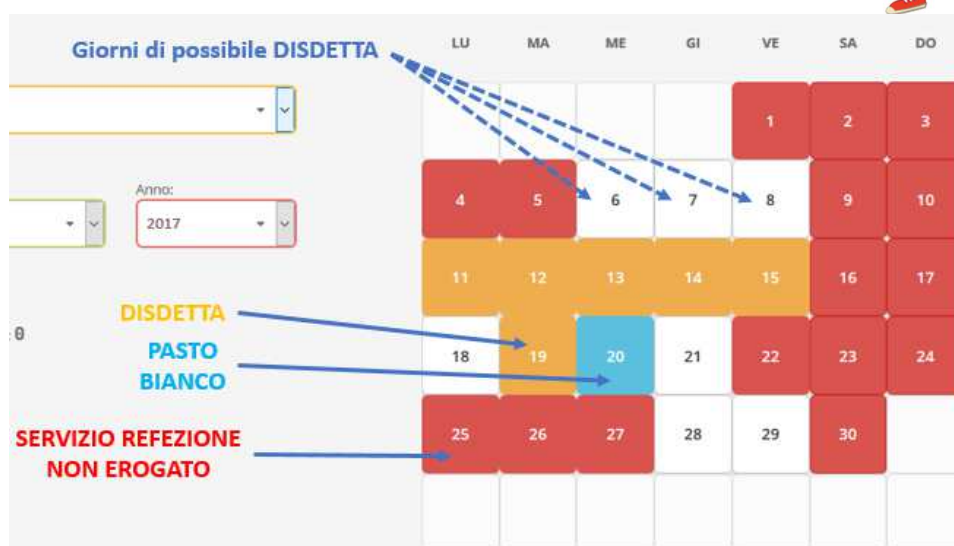
Portale Genitori 3: Esempio di situazione presenze e disdette in calendario